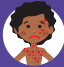
راش های جلدی کہ با فشار دادن محو نمی شوند