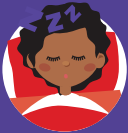
خواب آلودگی یا سرگیجی